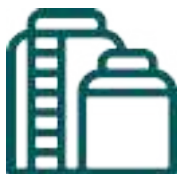
CISTERNAS Y TINACOS DOMÉSTICOS